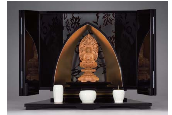
アーチ部分が個性的。多様化するスタイルに合わせた厨子。 新型厨子—INORI— (幅合板/漆塗・総蠟色仕上、本金箔押/幅55.5×奥行32.5×高さ44cm) 1,296,000円 ※仏具は別売りです。