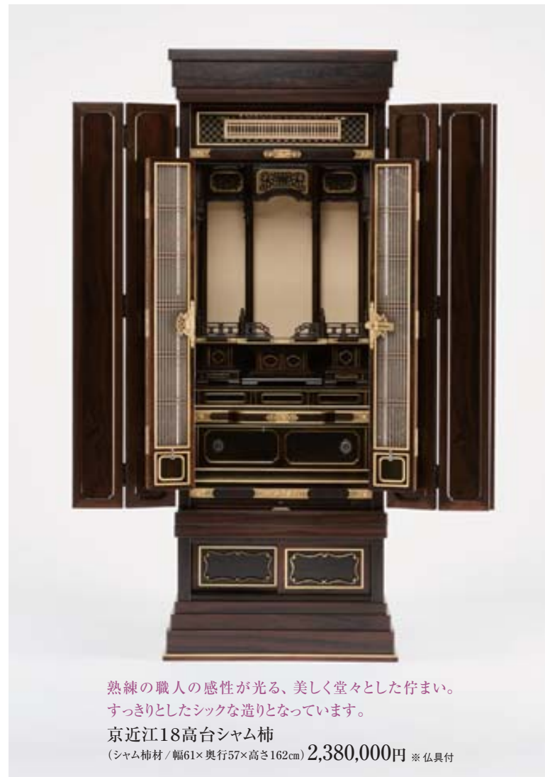
熟練の職人の感性が光る、美しく堂々とした佇まい。 すっきりとしたシックな造りとなっています。 京近江18高台シャム柿 (シャム柿材/幅61×奥行57×高さ162cm) 2,380,000円 ※仏具付

風格のある伝統的な作りから、 現代の住居にもマッチするスタイルまで、 多彩な仏壇・仏具をご紹介します。