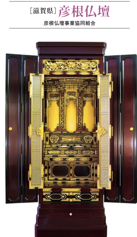
〔滋賀県〕彦根仏壇 彦根仏壇事業協同組合