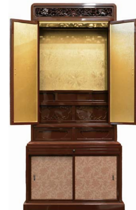
左/金箔押、高蒔絵 など、京の職人の矜持 が息づく優美な仏壇。 浄土真宗東用 仏壇上置型 (半田地、本漆塗・蠟色、金箔押 高蒔絵、毛彫金具、木彫欄間 幅55×奥行46×高さ86cm) 5,184,000円