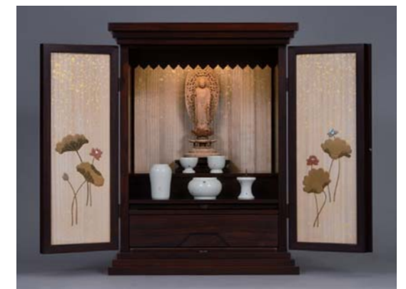
戸板には砂子、扉の内側には蓮の蒔絵が施された格調高い品。 紫檀桐戸板蓮水蒔絵厨子 (台輪:本紫檀(パイオン)厚板貼り 戸板:桐材無垢 主芯材:天然木材(ニヤトウ) 漆塗、木地蒔絵/幅42×奥行32×高さ56cm /LED照明付) 1,200,000円 ※仏具は別売です。