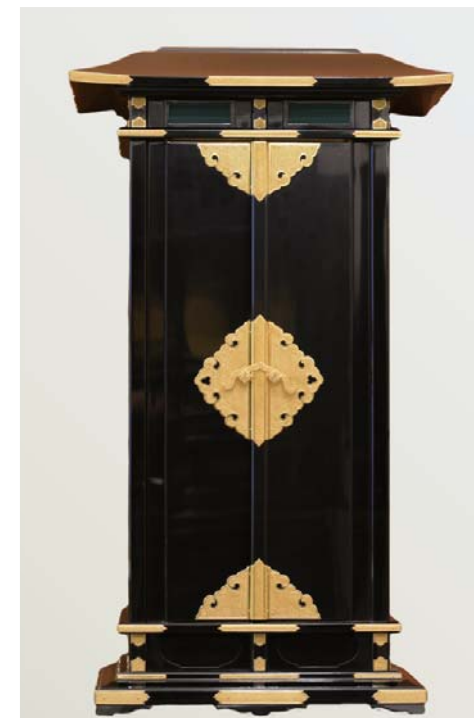
ゆるやかな勾配の屋根など、春日厨子の伝統 を踏襲した、重厚にして華麗な佇まいが魅力。 春日厨子 (松材/堅地本漆塗・総蠟色仕上 鍍金具:純金箔5度押・アマルガム金メッキ、一粒魚々子 幅43×奥行30×高さ76cm) 6,696,000円